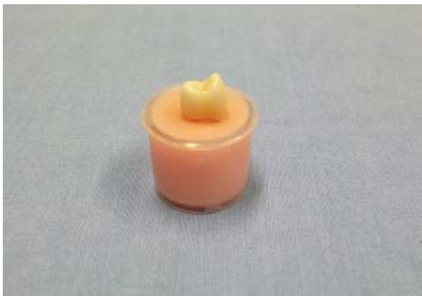
Sl. 2 – Premolar postavljen u autopolimerizujući akrilat

mm, dobija se kao imitacija periodontalne membrane prema- zivanjem korena gotovim fabričkim preparatom – Anti- Rutsch-Lack (Wenko-Wenselaar GmbH, Germany). Zubni korenovi zatim su uronjeni u samovezujući akrilat “Techno- vit” (Heraeus Kulzer GmbH, Germany), koji imitira koštanu potporu zuba. Zamešani akrilat stavljen je u posebne plastične kalupe – posude, i zubi su uronjeni u njega pomoću nosa- ča do potpunog vezivanja akrilata (slika 2).