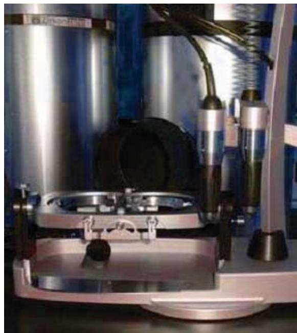
Sl. 4 – Uređaj za kopirajuće frezovanje keramičkih blokova, tipa “Zirkograph” (ZirkonZahn, Germany)

Kod obe eksperimentalne grupe, keramičke krune izra- đene su od dve vrste gradivnih keramičkih materijala: cir- konijumske keramike za izradu supstrukture i kompatibilne feldspatne keramike za prekrivanje supstrukture i dobijanje definitivne morfologije krune premolara. Tehnička aparatura predstavlja „kopir frez“ sistem za izradu keramičkih krana na bazi linijske demarkacije pod nazivom „ZirkonZahn“, isto- imene nemačke firme (slika 4). Fabrički blokovi cirkonijum- dioksida pod nazivom „ICE Zirconia Blanks“ (ZirkonZahn GMBH, Gais, Germany) izrađuju se u različitim veličinama prema postojećoj indikaciji – za izradu pojedinačnih krana pa sve do jednokomadnih mostova od 16 članova. Blokovi se veoma lako mašinski obrađuju jer cirkonijum nije prethodno sinterovan, već je samo tvrdo presovan i ima veoma visoku primarnu gustinu. Blokovi se dobijaju postupkom hladnog izostatskog presovanja čime nastaju keramičke preforme, koje svojim izgledom podsećaju na kredu i nazivaju se svež ili sirovi cirkonijum.