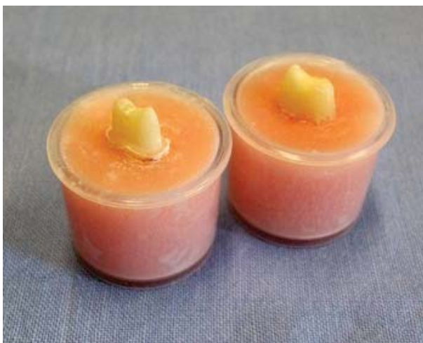
Sl. 3 – Ispreparisani premolari: uzorak levo – preparacija sa stepenikom; uzorak desno – linijska preparacija

Preparaciju zuba za prihvatanje krune izvršio je jedan operator – kliničar, koristeći odgovarajući komplet bušilica za uklanjanje zubne supstance i postizanje željene forme preparacije – komplet oznake 800-841-4522 (Brasseler, USA). Preparacija je izvedena turbinskim radnim nastavkom modela Sirona T1 (Siemens, Germany) uz hlađenje vodenim sprejom. Kod oba tipa preparacije aksijalna konvergencija iznosila je 6°, dok je stepenik prepariran pod uglom od 90° sa unutrašnjim zaobljenjem ukupne širine od 1mm (slika 3).