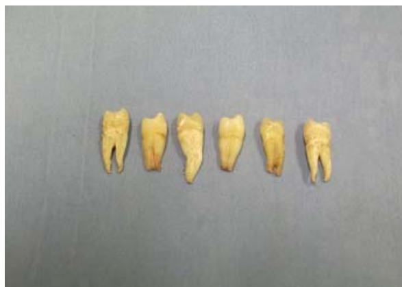
Sl. 1 – Premolari ekstrahovani iz ortodontskih razloga

Nosači keramičkih kruna izrađeni su od nekarioznih ekstrahovanih prvih premolara, koji su izvađeni iz ortodontskih razloga (slika 1). Do početka ispitivanja ekstrahovani zubi su čuvani na sobnoj temperaturi u 0,1% rastvoru timola, kao antibakterijskom i antioksidativnom sredstvu, ne duže od tri meseca. Ukupno 60 premolara podeljeno je u dve eksperimentalne grupe: grupu A u kojoj se nalazilo 30 zuba planiranih za linijsku preparaciju i grupu B sa 30 zuba planiranih za preparaciju oblika stepenika pod uglom od 90°, sa unutrašnjim zaobljenim uglom.