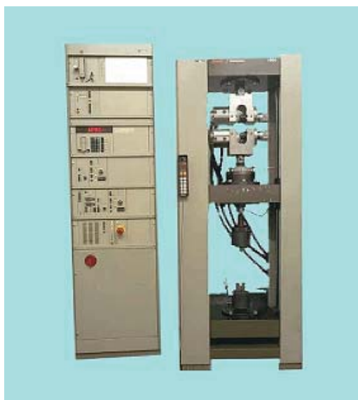
Sl. 6 – Uređaj za ispitivanje otpornosti materijala tipa "Zwick 1464" (Zwick, Germany)

Za procenu mehaničke otpornosti korišćen je test pritiska sa sferičnim opterećenjem. To je najčešće korišćen test za procenu čvrstoće keramičkih krunica, blizak realnoj kliničkoj situaciji. Univerzalna elektromehanička mašina za testiranje materijala firme Zwick, tip 1464 (Ulm, Germany) kretala se brzinom 0,5 mm/min do pojave loma keramičkih krunica (slika 6).