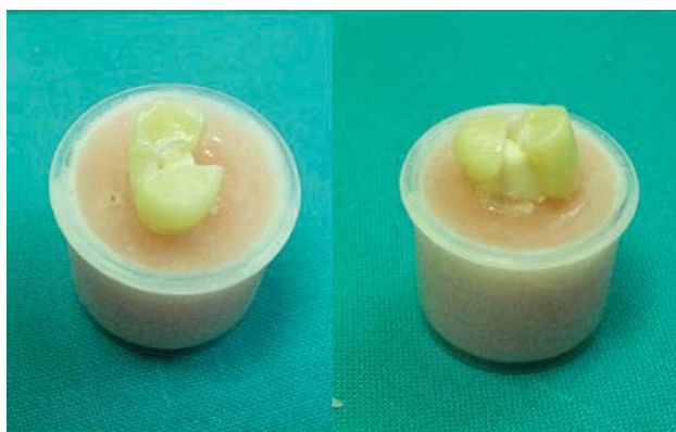
Sl. 8 – Lom keramičke krunice pod dejstvom opterećenja

Istraživanje je sprovedeno kao eksperimentalna studija. U statističkoj obradi je primanjen deskriptivni statistički metod, a rezultati su predstavljeni kao srednja vrednost i standardna devijacija. Značajnost razlika između obeležja posmatranja utvrđena je Studentovim t -testom i prihvatana na nivou od 0,05 i većem.