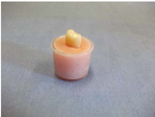
Sl. 5 – Keramička krunica cementirana na ispreparisanim premolarima

Gotove krunice cementirane su za zube nosače upotrebom kompozitnog adhezivnog sistema sa dvostrukim (svetlosnim i hemijskim) vezivanjem. Korišćen je adhezivni cement "Panavia F" proizvođača "Kuraray" (Tokyo, Japan). Posle nanošenja cementa uzorci su držani pod statičkim pritiskom od 40 N u trajanju od 7 min što predstavlja vreme vezivanja ovog cementa (slika 5).