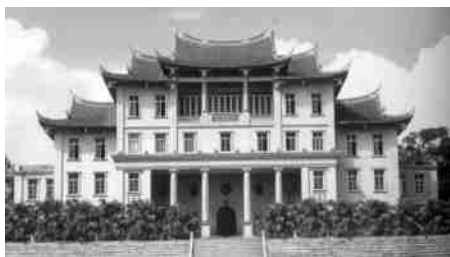
图3 建南楼群大礼堂 Fig.3 Main hall of jiannan building