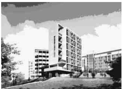
图9 多层学生宿舍透视

多层宿舍平面选用了不同于高层宿舍的外通廊式宿舍平面、标准单元采用六人间的模式;建筑采用逐级跌落的交往平台与山地地形取得衔接,强化学生相互之间交往的构思,同时,也打破传统宿舍单调乏味的做法,丰富了建筑空间;在立面上也考虑同高层宿舍的呼应(图9)。