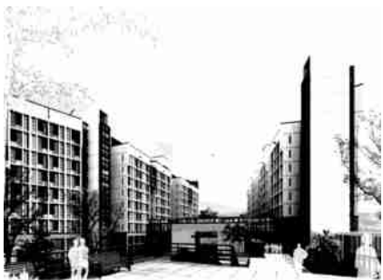
图8 高层学生宿舍透视示意

要疏散楼梯和电梯厅,两侧为四人间学生宿舍,学生宿舍配套独立盥洗间和卫生间,标准楼层均设置活动室,贯彻多元化生活空间的理念;为求建筑形体更为丰富,高层宿舍部分采用局部单向坡屋顶的处理手法,结合标准宿舍单元立面构成元素,采用白墙灰瓦搭配阳台的木色铝合金百叶,从而创造出一种富有韵律又错落有致的高层宿舍建筑形象(图8)。