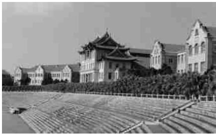
图2 建南楼群 Fig.2 Jiannan buildings