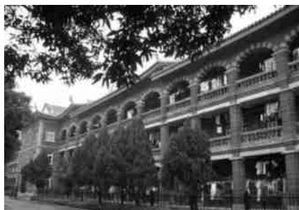
图4 芙蓉楼群 Fig.4 Lotus buildings

幢建筑里。在工匠的选用上,陈嘉庚坚持任用本地的能工巧匠,并运用地方传统施工工艺。