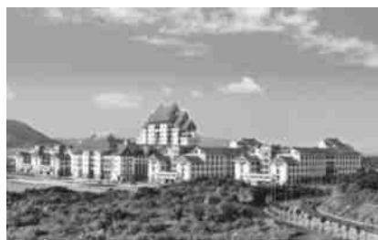
图7 漳州校区主楼群西立面