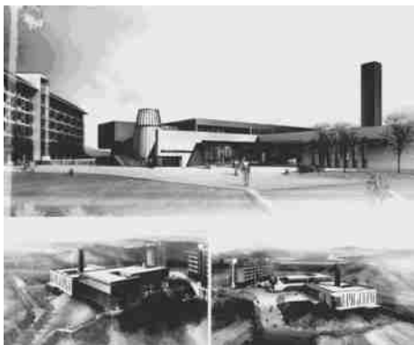
图11 学生餐厅方案透视