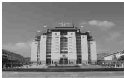
图8 漳州校区主楼群主楼正立面