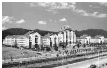
图6 漳州校区主楼群东立面

主楼群由图书馆与公共教学楼群体、院系楼群体、实验楼群体及办公楼组成(图6~图8)。居中的主楼十二层,建筑面积约4.5万 m^2 ;两侧四座从楼均为五层,每座约1.8万 m^2 ,楼群左右面宽逾370 m,纵深百余米,南北有5 m宽长廊贯穿整个建筑群,使楼群成为一个有机整体。