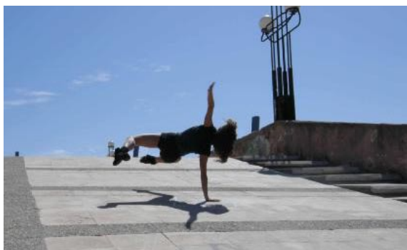
Fig. 2: Visión de una participante bailando