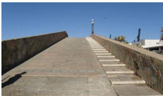
Fig. 1: Visión de la cuesta

La música es una canción del grupo Modest Mouse, titulada "So beauty" Su duración es de un minuto y veinticuatro segundos, con un ritmo continuo y plana en su melodía, sin carga emotiva, y con una letra neutra. Se buscaba primar la relevancia del espacio sobre la música.